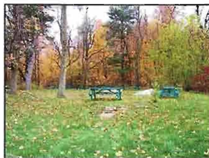
Aire de pique-nique au mont Saint-Grégoire

En janvier 2006, CIME acquiert les propriétés Deschênes et quitte les bureaux qu'il occupe depuis plus de 20 ans au centre-ville de Saint-Jean-sur-Richelieu pour emménager au 16 chemin du Sous-Bois à Mont-Saint-Grégoire. En mai, l'organisme tient une conférence de presse pour souligner l'ouverture officielle des sentiers et remercier ses nombreux partenaires. En juin, débutent les travaux d'amélioration de l'aire d'accueil et de réfection des sentiers. En juillet, CIME lance son site internet, un outil qui permet de diffuser une foule d'informations sur l'organisme : mission, activités, nouveautés, etc. À la fin d'août, un incendie détruit complètement un bâtiment agricole dans lequel se trouvait un entrepôt frigorifique. Un projet de reconstruction est à l'étude dans les mois suivants. L'organisme adhère à des organisations de promotion touristiques comme l'Office du tourisme et des Congrès du Haut-Richelieu et l'Association touristique de la Montérégie.