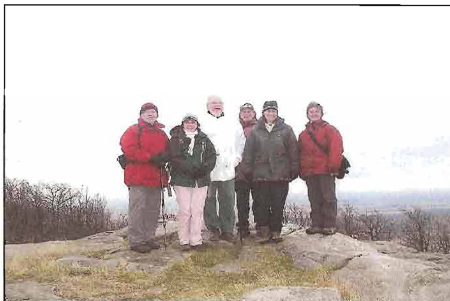
Une partie du conseil d'administration de CIME au sommet du mont Saint-Grégoire en novembre 2006