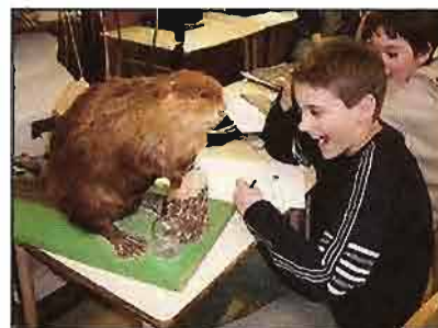
Atelier Les animaux sauvages

Le déménagement des bureaux administratifs de l'organisme au mont Saint-Grégoire et l'ouverture des sentiers au public sept jours sur sept amènent certains changements dans l'organisation des services. La gestion et le fonctionnement des excursions animées et des camps de jour s'en trouvent grandement améliorés. Par contre, CIME renonce à la gestion du service de location d'embarcations au Centre de plein air Ronald-Beauregard à Saint-Jean-sur-Richelieu. Les difficultés survenues au cours de l'été 2005 (vol, vandalisme) et l'éloignement du site motivent cette décision. Dans le cadre des services réguliers (excursions, camps de jour et ateliers en classe), les naturalistes de CIME rencontrent plus de 6 000 jeunes en 2006.